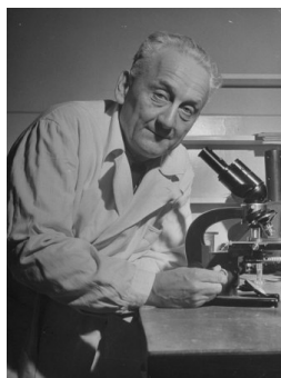
Szent-Györgyi Albert (1893—1986)

Az iskola arra való, hogyan az ember megtanuljon tanulni, hogyan felébredjen a tudásvágya, megismerje a jól végzett munka örömét, megízlelje az alkotás izgalmát, megtanulja szeretni, amit csinál, és megtalálja azt a munkát, amit szeretni fog.