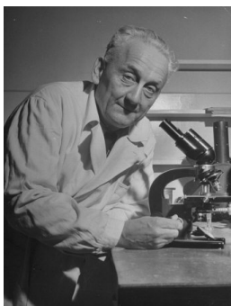
Szent-Györgyi Albert (1893—1986)

Az iskola arra való, hogyan az ember megtanuljon tanulni, hogyan felébredjen a tudásvágya, megismerje a jól végzett munka örömét, megízlelje az alkotás izgalmát, megtanulja szeretni, amit csinál, és megtalálja azt a munkát, amit szeretni fog.