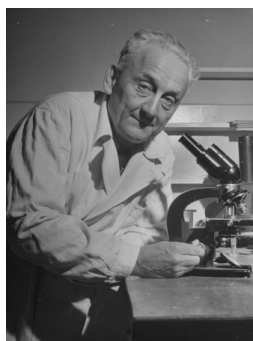
Szent-Györgyi Albert (1893—1986)

Az iskola arra való, hogyan az ember megtanuljon tanulni, hogyan felébredjen a tudásvágya, megismerje a jól végzett munka örömét, megízlelje az alkotás izgalmát, megtanulja szeretni, amit csinál, és megtalálja azt a munkát, amit szeretni fog.