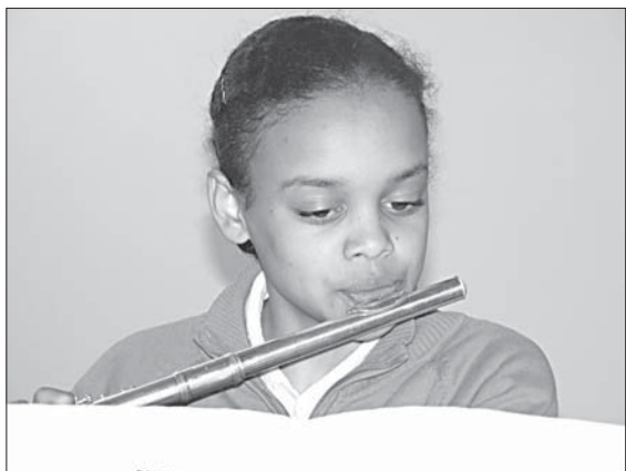
...és Magyar Elin adott koncertet