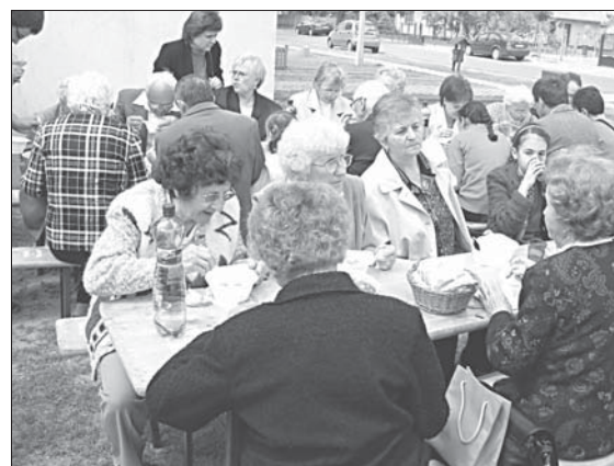
...a helyben, kondérban főtt Jókai-bablevest