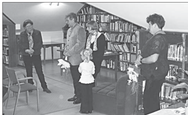
A kiállítás megnyitóján