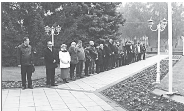
A koszorúzóknak a sorfala