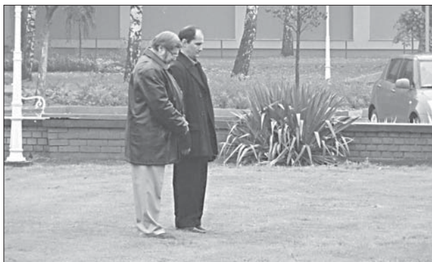
A Fidesz nevében tisztelgők