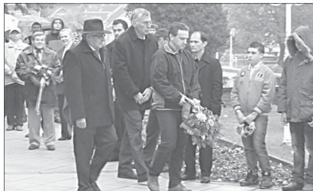
A Polgári Kör koszorúzóit